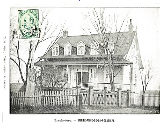
Presbytère. — SAINTE-ANNE-DE-LA-POCATIÈRE.